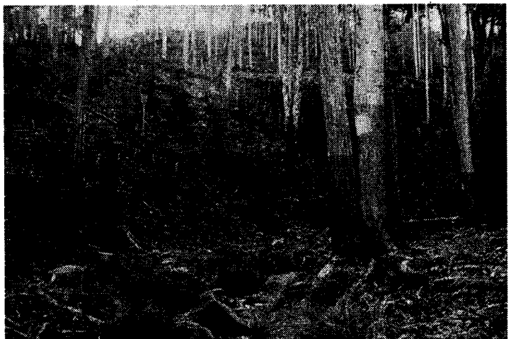
根元からプラスチックのネットで囲っている。食害で枯れた立木もみられる。