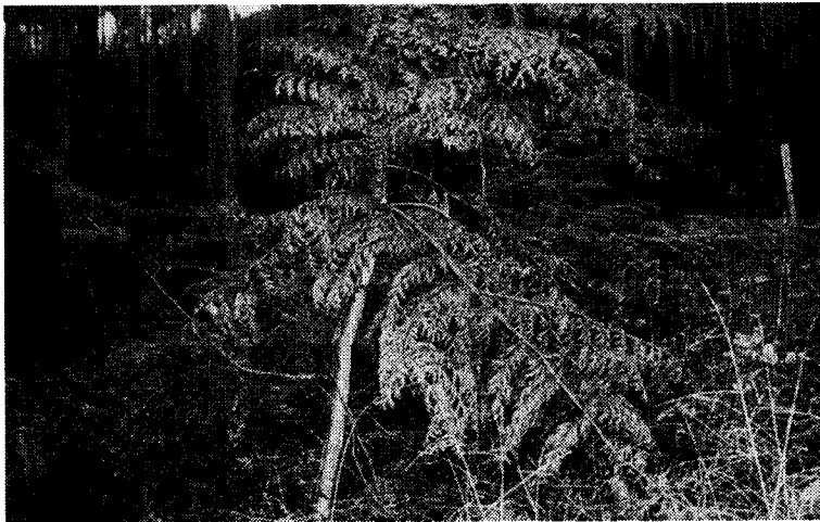
植えたばかりの苗木もシカにかじられて枯れてしまった

まるで公園のようにきれいに手入れされた杉林の中を登り、1901年に都が水源林創設100周年を記念して設置した「水源林100年の森」へ行く。標高1,200㍍の森林は寒かったが、1㍍に300本から200本を残して間伐し、枝打ちなど手入れが行き届いた杉林は明るく公園のように美しい。だが